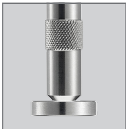
Montagebeispiel mit 22 mm Silikonadapter (835008)

Der Wash-Sensor H Dental Prüfkörper mit montiertem Adapter kann direkt in die Silikonadapter für Übertragungsinstrumente eingesteckt werden.